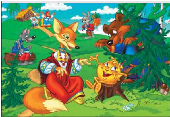
Народная русская «Колобок» в обработке А.Н. Толстого