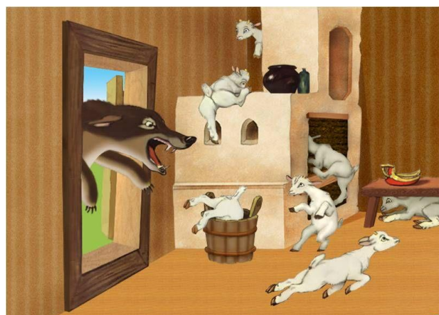
Сказка «Волк и семеро козлят» Братьев Гримм